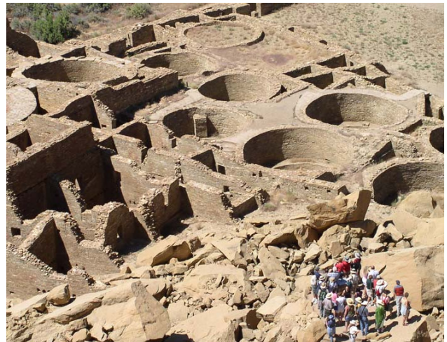
차코 문화역사공원:푸에블로 보니타