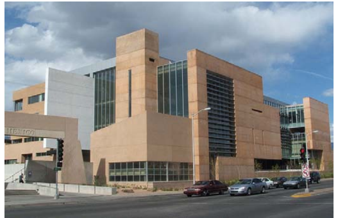
뉴멕시코 대학교 캠퍼스 내의 건물 (George Pearl Hall)