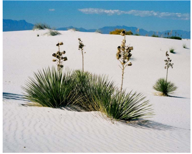
화이트 샌드 내셔널 모뉴먼트: 모래언덕과 유카(Yucca). 유카꽃은 뉴멕시코 주를 상징하는 꽃이다.