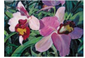
알버커키 박영숙 화가(www.youngsookpark.com)와 김수영 화가(www.geocities.com/hongsooyoungstudio)의 작품들입니다.