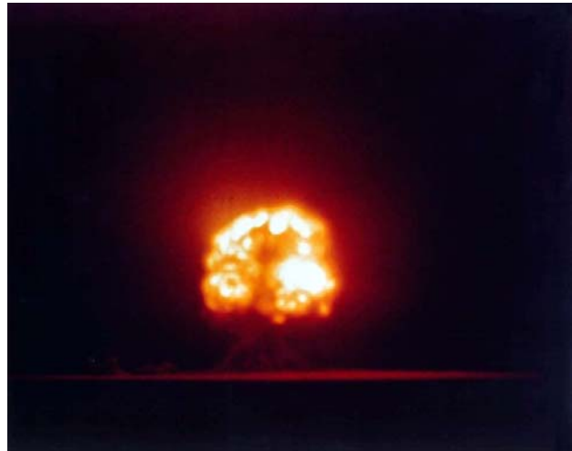
1945년7월16일 뉴멕시코 주 사막에서의 최초의 핵폭탄 시험에서 찍은 화염.

조건이 되어서 이차대전 시기에 세 개의 공군기지가 들어서게 되었다. 화이트샌드 미사일 시험장(White Sands Missile Range)도 생겼다. 험한 계곡이 있는 산속에 비밀유지 하기 좋은 지리 조건을 가춘 로스 알라모스(Los Alamos)에는 원자탄 개발을 위한 연구소가 생겼고 1945년 7월16일 뉴멕시코 남부 사막에서 최초의 원자탄을 터뜨리는 실험을 하여 핵시대의 문을 연 것도 뉴멕시코에서 일어난 일이다.