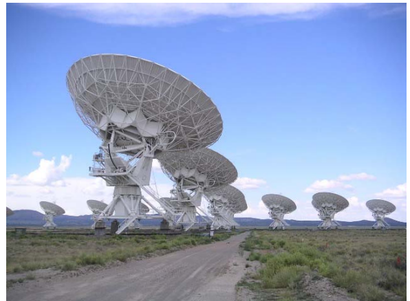
소코로 60마일 서쪽에 있는 VLA(Very Large Array) 안테나. 오페레이션 센터는 소코로의 광산 공과대학 캠퍼스에 있다.