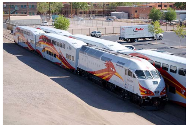
산타페와 알버커키와 벨렌 사이를 운행하는 뉴멕시코 레일러너(Rail Runner)열차

뉴멕시코 주 경제 고속도로 간판. 멕시코 음식에서 필수인 고추(Chili)가 그려져 있다. 뉴멕시코를 상징하는 질문은 "RED OR GREEN?"인데 이는 멕시코 음식 식당 종업원에게서 자주 듣는 빨간 고추와 녹색 고추 소스 중에 하나를 택해달라는 질문이기 때문이다.