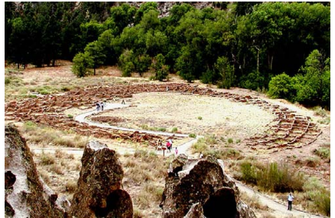
반델리어 내셔널 모뉴먼트:큐웨니 유적지