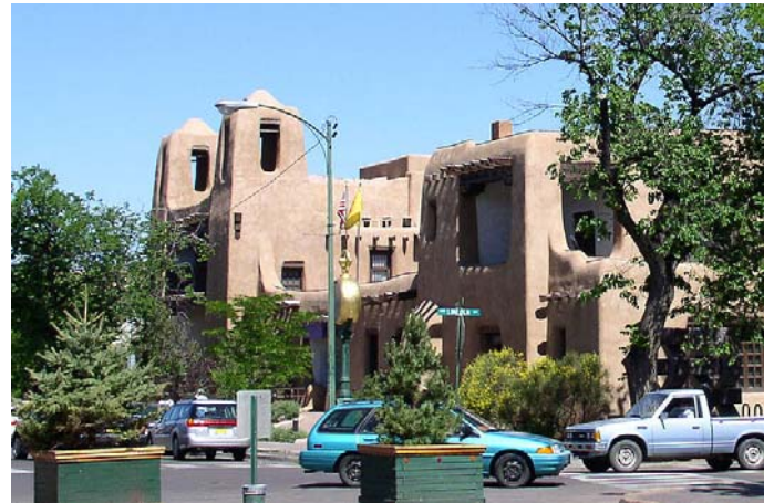
산타페 미술 박물관: 푸에블로 리바이벌 스타일의 건축양식이 이지역 건물의 특징이다.

뉴멕시코는 인디언과 히스패닉과 앵글로의 세 가지 문화를 모두 가지고 있어서 이런 다양성을 자랑으로 여기고 있다. 뉴멕시코의 독특한 자연의 아름다움 때문에 1900년 초기 부터 많은 예술가들이 이 지역으로 이주해 온 것이 이곳 문화를 더 풍성하게 했다.