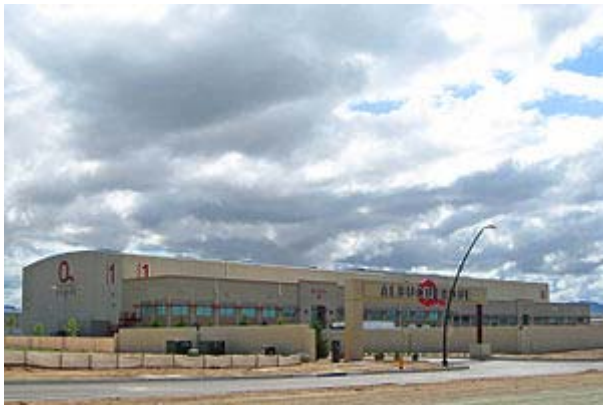
영화 제작을 위해 신축된 알버커키 스튜디오.