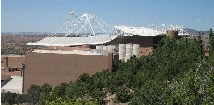
산타페 오페라 건물 사진

문학분야: 1959년 MGM 제작 벤허(Ben-Hur)란 영화는 1880년 출간된 문학작품 《벤허:그리스도의 이야기》(Ben-Hur: A Tale of the Christ)를 영화로 만든 것이었다. 이 소설은 쓴 루 월리스(Lew Wallace)는 뉴멕시코 주지사(뉴멕시코는 연방에 가입전이다)까지 역임 한 사람이다. 미술가와 마찬가지로 작가들도 많이 뉴멕시코로 이주해와서 산타페만도 현재 150명의 작가가 활동하고 있다. 한국인 황갑주 시인은 뉴멕시코에 1970년대에 잠시 거주했고 이곳 사막을 노래하는 많은 시를 발표했다.