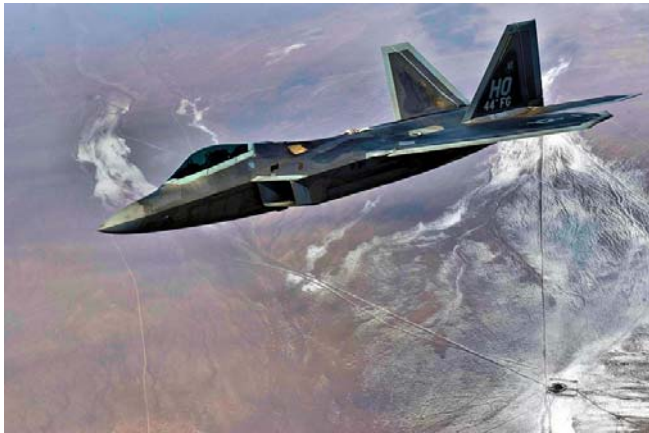
홀로만 공군 기지에 있는 F-22 랩터(Raptor) 전투기.