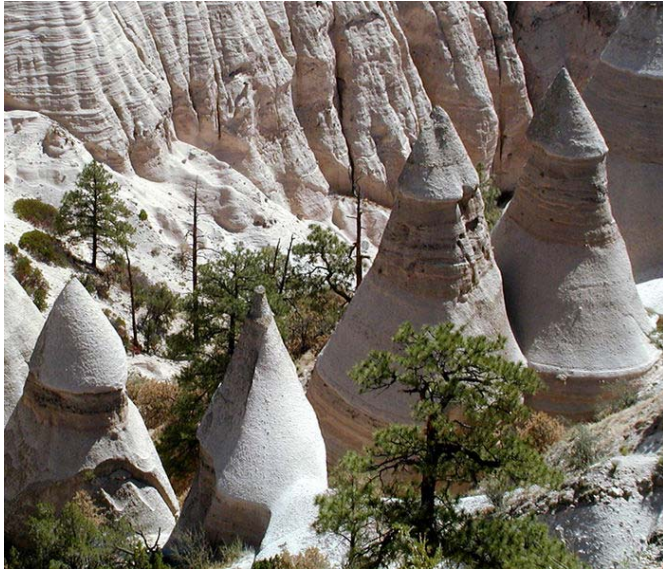
텐트락 내셔널 모뉴먼트

매혹의 땅이란 별명이 의미하는 그대로 관광 할 만한 경치 좋은 국립공원과 내셔널 모뉴먼트가 많다. 내셔널 모뉴먼트( National Monument)는 미국의 유적 보호법에 의거 대통령이 지정한 국립공원과 비슷한 성격을 가진 공원이다. 뉴멕시코 주에는 내셔널 모뉴먼트가 12곳이나 되어 미국에서 애리조나주 다음으로 모뉴먼트가 많은 주가 된다. 넓은 지역의 산과 숲이 국유림으로 관리되고 있어서 하이킹, 캠핑, 스키 등 야외 리크리에이션을 즐길수 있는 곳이 많다. 중요한 공원과 모뉴먼트를 열거하면 아래와 같다.